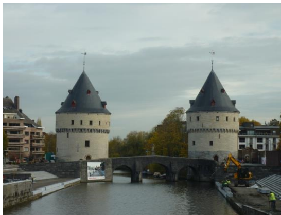
コルトレイクの風景